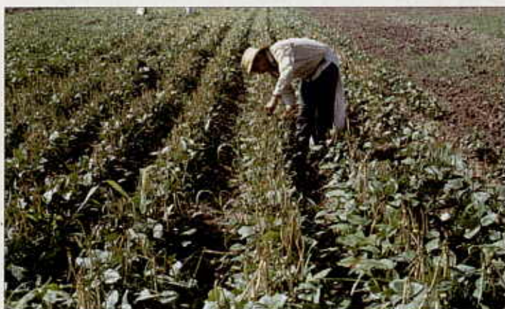
Rendimientos (kg/ha) de la variedad CORPOICA PROVINCIANO en pruebas regionales del Caribe Seco Colombiano