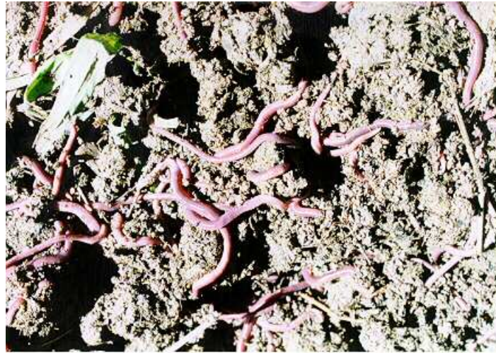
Figura1. Lombriz roja nativa adulta