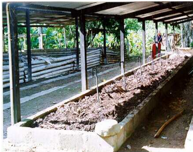
Figura 4 Lechos o eras y cajas de fermentación.