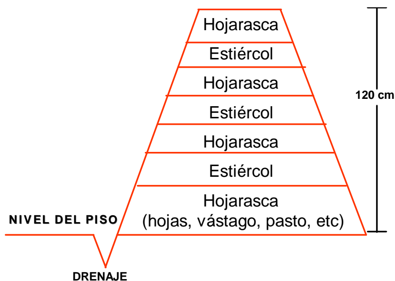
Figura 3. Secuencia del orden de las capas de los materiales en las cajas de fermentación.